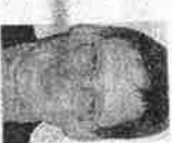
Der Autor ist Rechtsanwalt und Partner in der Kanzlei SNP in Charlottenburg. Seine Tätigkeitsschwerpunkte sind das Arbeits- und Gesellschaftsrecht. www.snp-online.de

Bleibt die Behörde untätig, ist die sogenannte Untätigkeitsklage vor dem Sozialgericht bereits nach Ablauf von drei Monaten zulässig. Diese Klage soll die Klärung der statusrechtlichen Fragen möglichst beschleunigen.